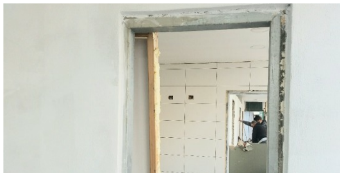
...y compris le carrelage. Prochaines étapes : les portes de chaque côté et...