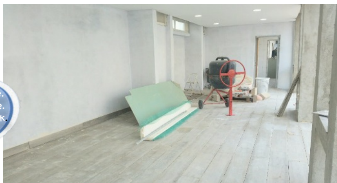
Le nouveau lounge de la piscine : une surface assez impressionnante et futur espace pour le programme de divertissement...plus de détails à la page 4