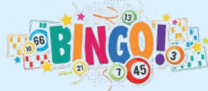
Soirées Bingo *