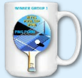
2ème tournoi de ping-pong

"Bon à savoir" : * Conférences sur des questions de nos immeubles peu connus - conjointement avec le Vaad Habayit