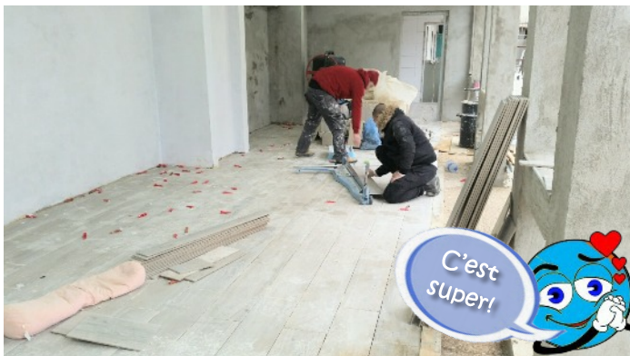
Des carreaux de céramique antidérapants ont été posés dans la zone de détente de la piscine et dans la cuisine.

Nous avons dû choisir des carreaux pour 4 zones : 1. le coin lounge agrandi avec la table de ping-pong et