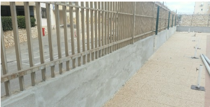
Tous les murs sous les nouveaux panneaux ont dû être réparés et fortifiés...