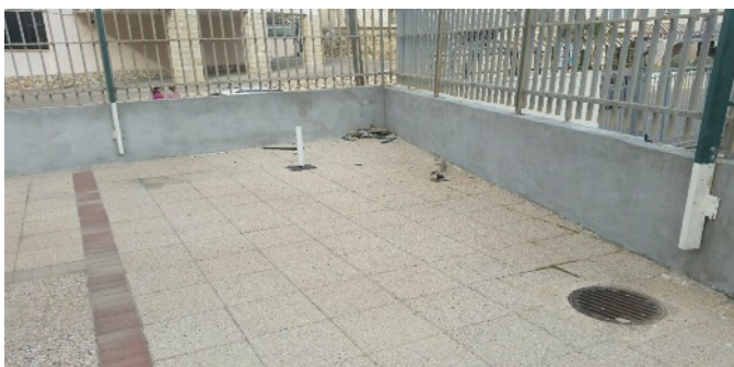
...à l'intérieur et sur le mur extérieur face au parking - un projet commun avec le Vaad Habayit.