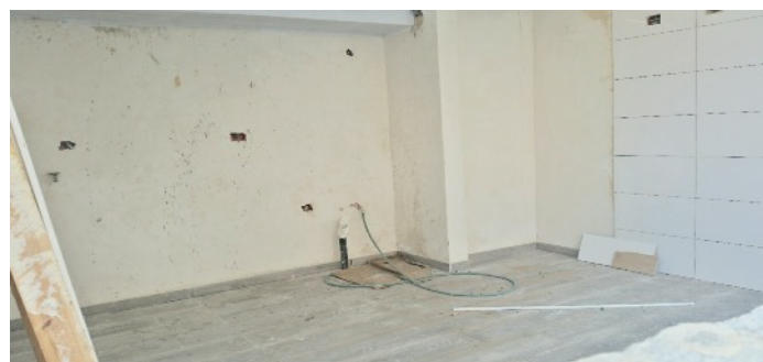
...l'équipement et la décoration, réalisés par un menuisier spécialisé