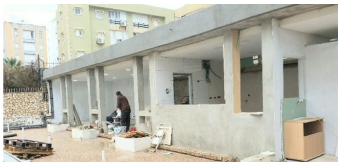
La structure de base pour la nouvelle cuisine ouverte avec un bar pour adultes et un pour les enfants est terminée...

La direction a presque finalisé tous les détails. Au cours des prochaines semaines nous informerons les actionnaires comment appliquer le système.