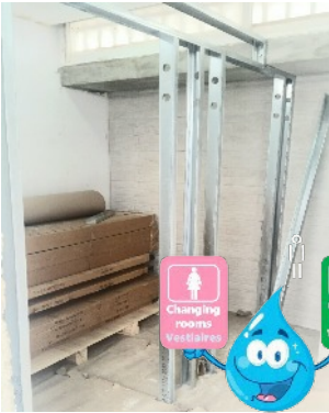
2 vestiaires dans chaque WC pour hommes et femmes