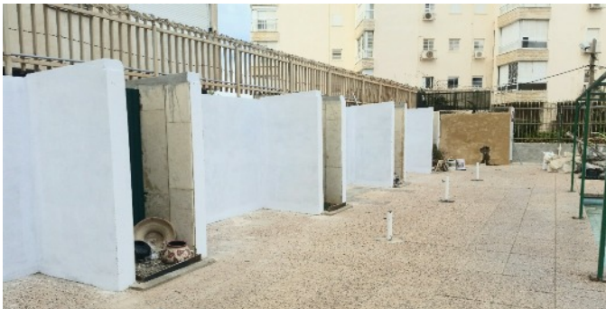
Travaux préparatoires pour 4 unités de stockage