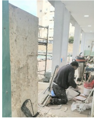
Amélioration de la zone d'entrée de la piscine