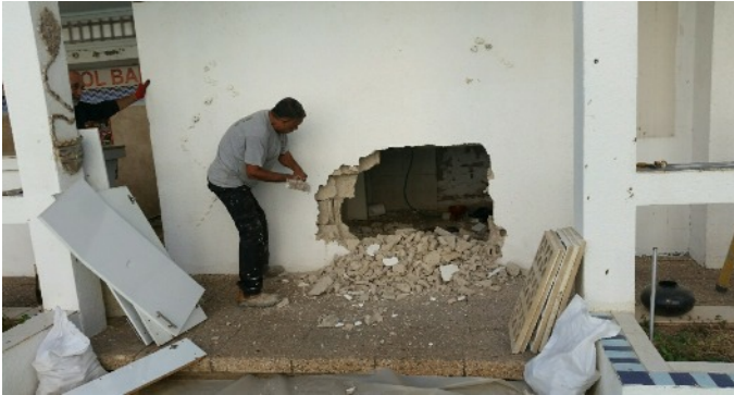
Début d'une nouvelle cuisine avec une meilleure vue d'ensemble de la piscine.