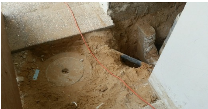
Surprise, surprise : Yossi a découvert une jonction cachée d'une conduite d'eau