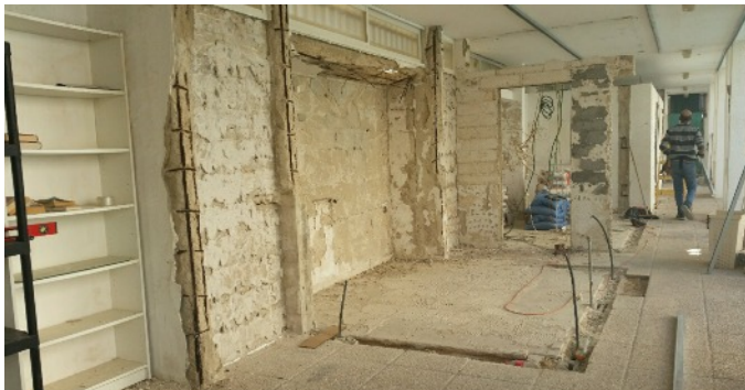
Le futur espace lounge de la piscine