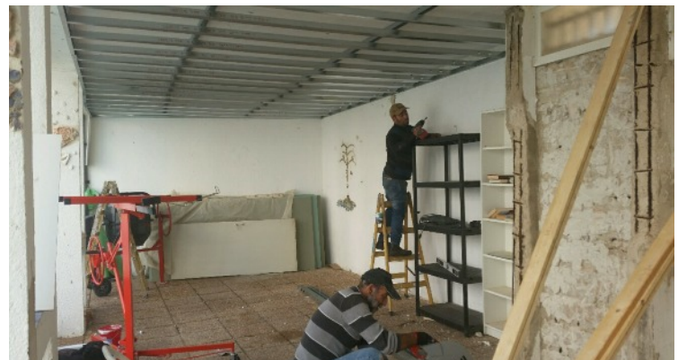
Pose de barres pour faux plafond....