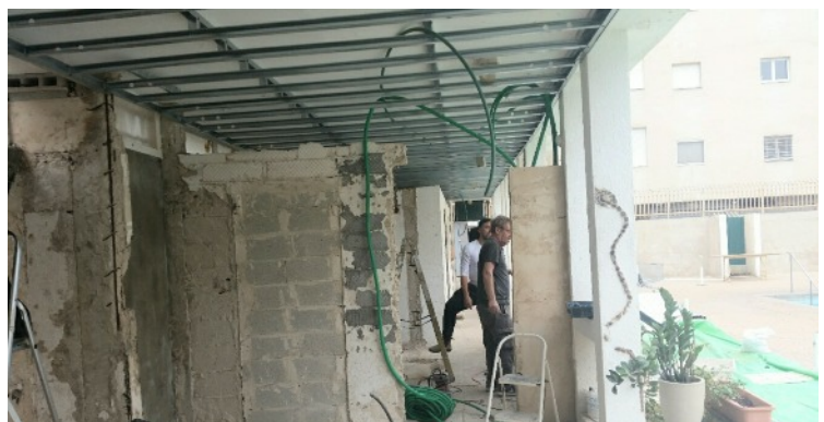
...pour cacher tous les câbles électriques