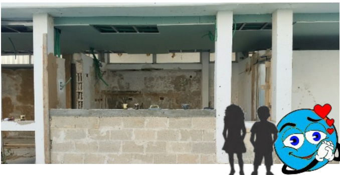
Forme du bar de la cuisine avec à droite un bar plus bas pour les enfants