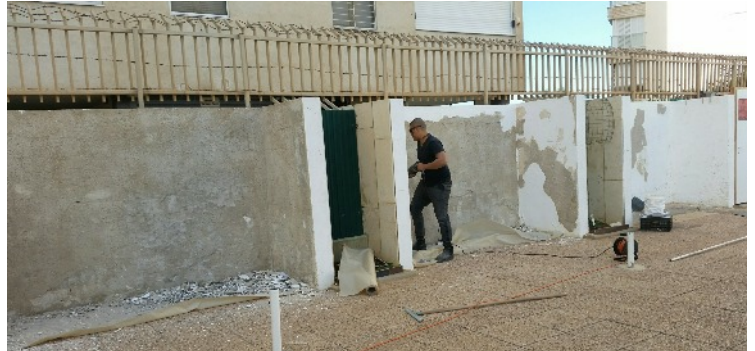
Mur côté ouest : nettoyage et réparation des murs pour peindre les futurs entrepôts couverts pour chaises-longues.

Ce fut tout un défi de déterminer les couleurs que nous allons appliquer aux différentes (nouvelles) installations. Nous avons été motivés par l'idée de ne pas ajouter beaucoup plus de couleurs à celles existantes. Notre objectif est d'obtenir un look global discret et valorisé avec des couleurs qui soutiennent cette idée. Nous répondrons également à la requête d'éviter des panneaux entièrement blancs pouvant nuire à la vue lorsqu'ils sont exposés à une forte lumière du soleil. Nous avons décidé d'aller un peu plus loin et d'appliquer un décor de panneau subtil qui est censé briser la lumière.